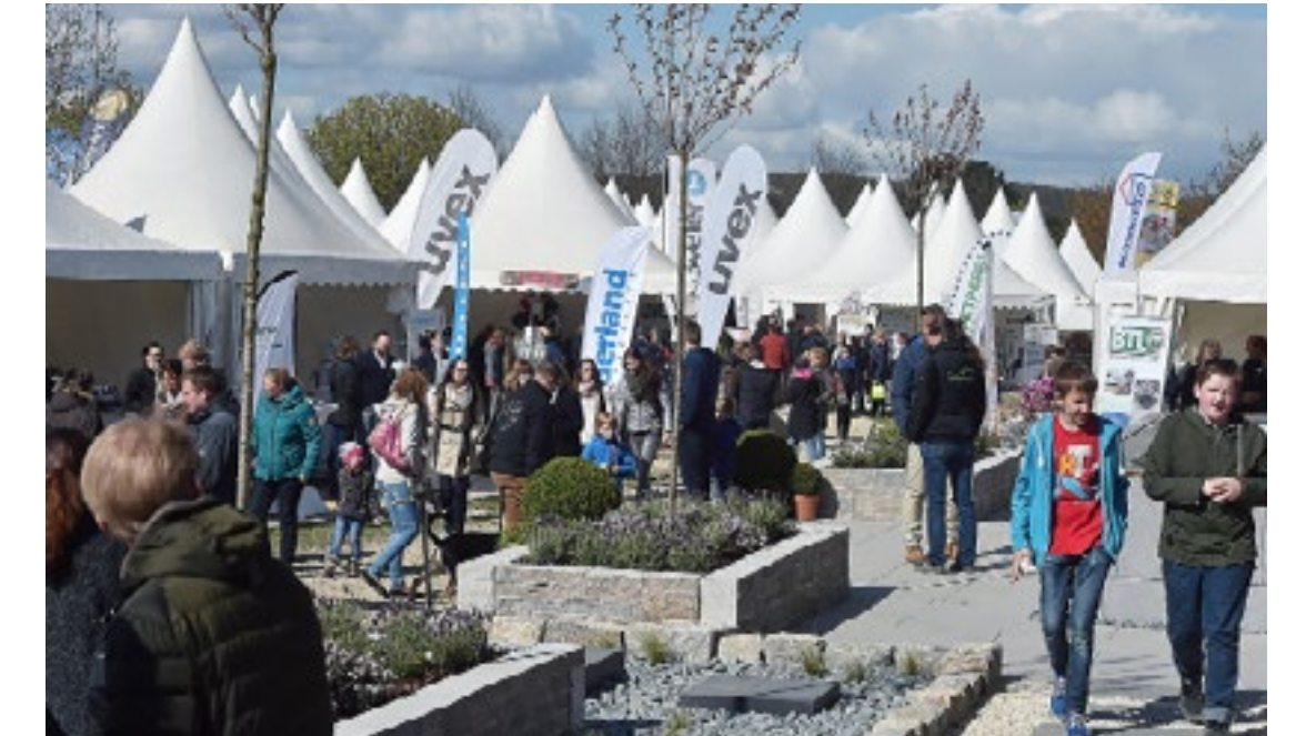
Global Dressage Forum Oktober 2016