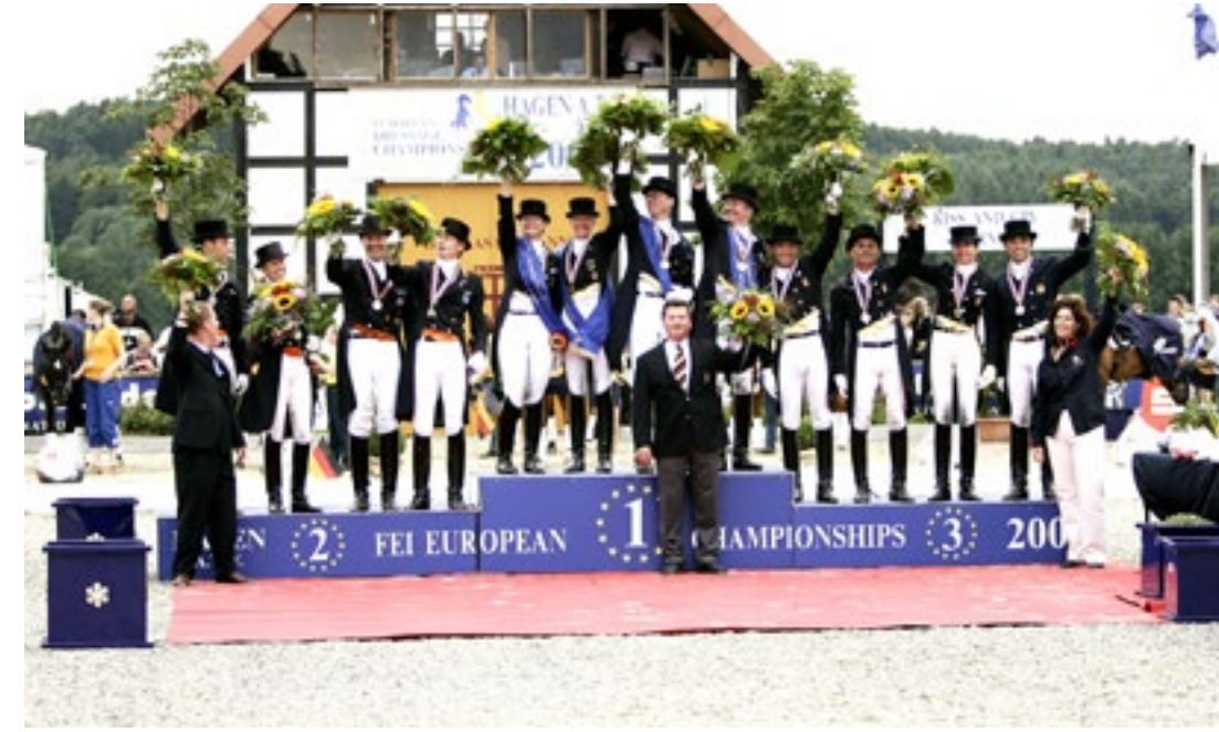
Europameisterschaft Senioren Dressur 2005