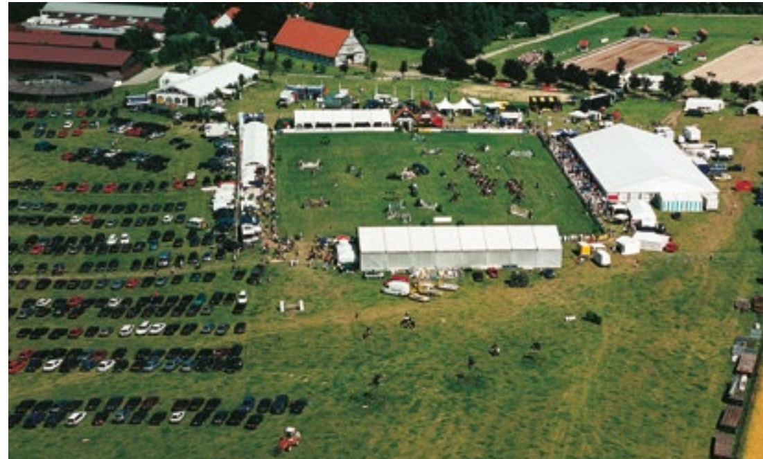
Europameisterschaft Pony Dressur / Springen / Vielseitigkeit 2000 & 2002