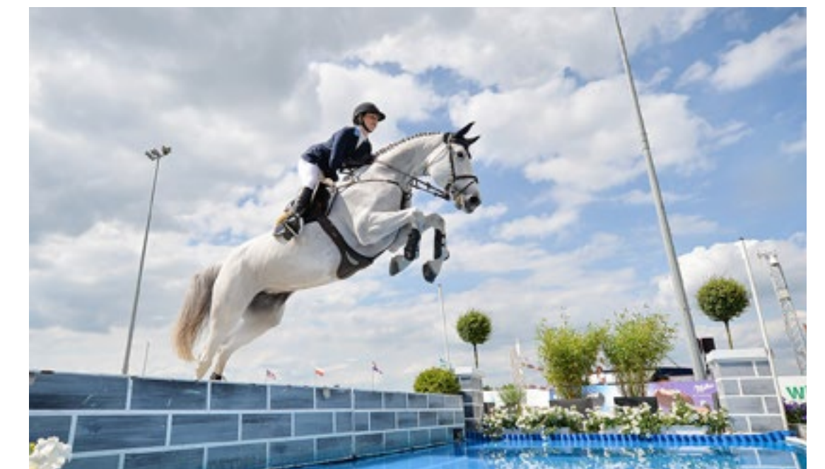
Future Champions Juni 2021