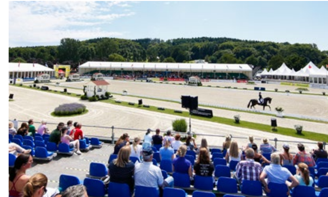
CDIO 2015 Dressurnationenpreis