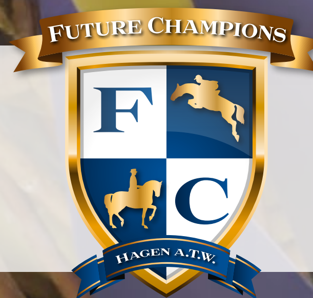
Aftermovie Future Champions