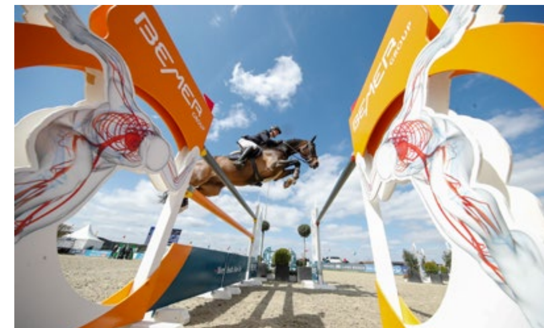
Redefin Mai 2021