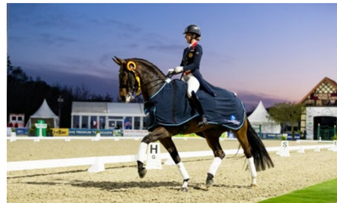
Horses & Dreams April 2021