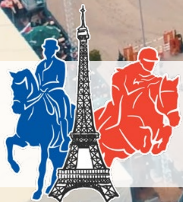
Aftermovie Horses & Dreams meets France